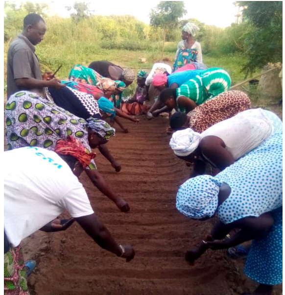
Le groupement de femmes au travail

Ce projet consistera à sécuriser une parcelle d'un hectare contre la divagation animale par l'installation d'une clôture ; et la mise en place d'un forage, la profondeur de la nappe phréatique dans ce secteur s'avérant trop profonde pour la construction d'un simple puits. Ce lieu constituera un prototype agroécologique avec une large partie consacrée à la création d'un espace agroforestier – arbres fertilisants associés à des arbres fruitiers. Il a aussi pour objectif de soutenir l'émancipation et le renforcement des compétences de ces femmes par des formations, un suivi-conseil de terrain, et en leur donnant accès à des activités productives, valorisées par la société.